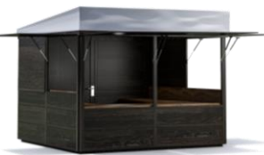
CITYSTAND 3 x 3 m Pulldach