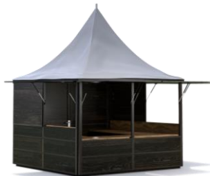
HÜTTENPAGODE 3 x 3 m Spitzdach