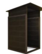
MARONIHÜTTE 1,5 x 1,5 m Pulldach