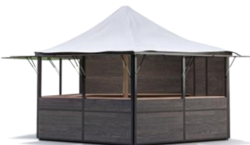
PAVILLON braun 5-Eck / d=5,4 m Spitzdach