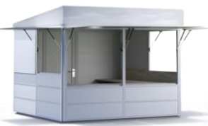
CITYSTAND weiß 3 x 3 m Pulldach