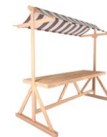
INDOORSTAND 2 x 1 m Stoffdach