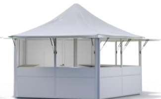
PAVILLON weiß 5-Eck / d=5,4 m Spitzdach