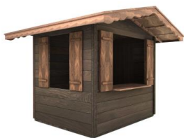
ALMHÜTTE RUSTIKAL 2,4 x 2 m Giebeldach