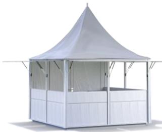
WEISSE HÜTTE 3 x 3 m Spitzdach