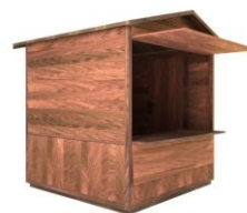
GIEBELDACHHÜTTE 2 x 2 m Giebeldach