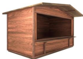
ALMHÜTTE SALZBURG 3,5 x 2 m Giebeldach