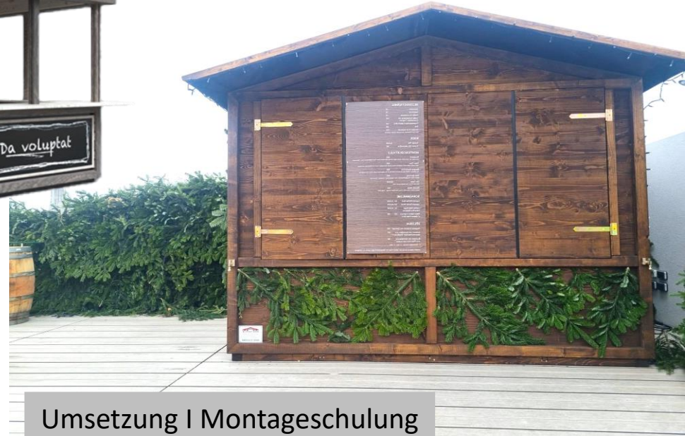
Umsetzung | Montageschulung

Natürlich bieten wir auch immer wieder GEBRAUCHTHÜTTEN oder KOMMISSIONSWARE an! Informationen dazu finden Sie auf unserer Homepage www.huette.at