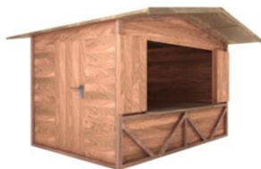
ALMHÜTTE TIROL 3 x 2 m Giebeldach